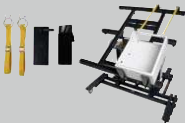
SCHALTSCHRANKSET Art.-Nr. 03100-005