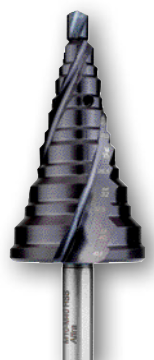
Art.nr. 08085 n