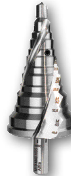
Art.nr. 08084 n