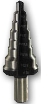
Art.nr. 08005 n 6