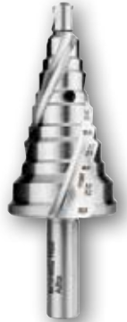
Art.nr. 08082 n