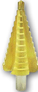
Art.nr. 08004 n 6